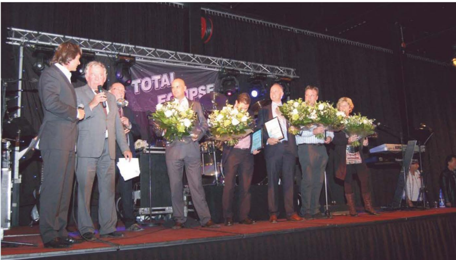
Top prestaties van alle genomineerden