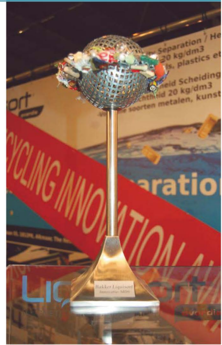
Trofee gemaakt door Bert Krabbenborg