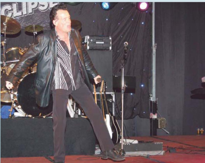
George was er ook