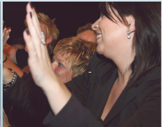
Meezingen voor het podium